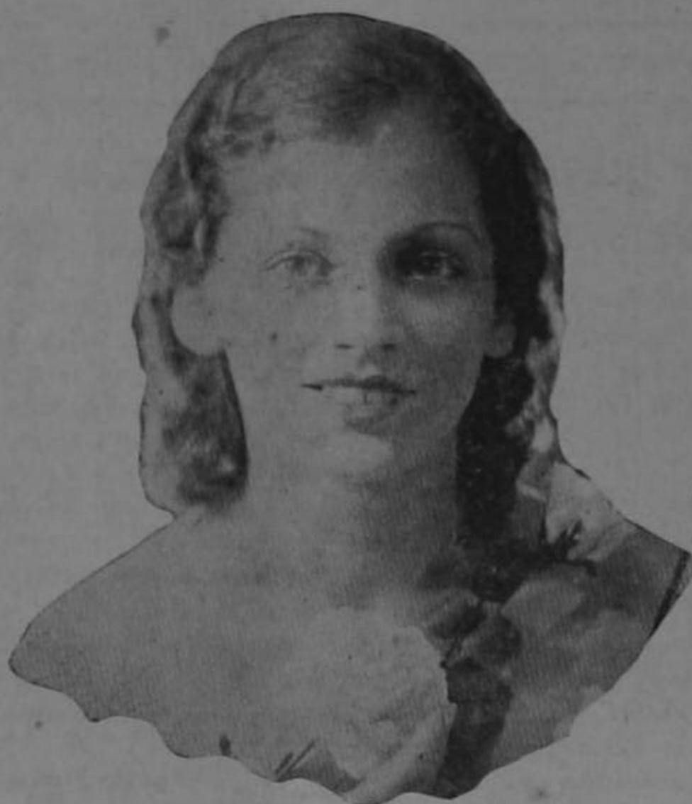
Distinguida joven señora a quien saludamos en su regreso a la ciudad, después de un corto viaje por la República de Panamá.